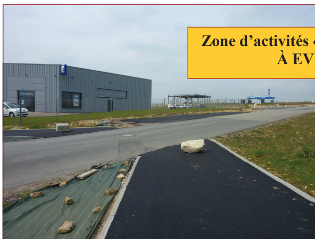
Zone d'activités « la croix boucher À EVRECY