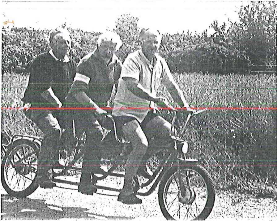
Randonnée cycliste: un bel effort des 3 B.

Les activités traditionnelles ont connu leur habituel succès: les 3 Concours de Belote ont connu une participation record, toujours supérieure à 40 doublettes, (avec toutefois le regret de ne pas voir plus d'amateurs de la Commune...). Rappelons que le 3ème Concours (56 doublettes) était, comme chaque année, organisé au profit des enfants de l'Ecole.